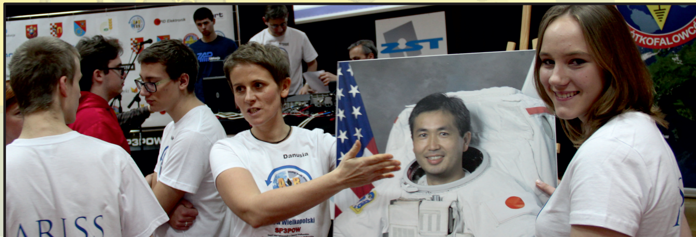
ARISS w Ostrowie Wielkopolskim, 8 stycznia 2014 r.

Uczniowie podczas przygotowań do łączności radiowej z astronautą mają możliwość obcować z najnowszymi technikami radiokomunikacyjnymi i problemami z tym związanymi. Mają możliwość poznania życia w przestrzeni kosmicznej oraz zadań związanych z istnieniem ISS. Udział w programie ARISS pozwala rozwijać zainteresowania naukami związanymi z eksploracją kosmosu. Bezpośrednia rozmowa z astronautą będącym w kosmosie, to dla młodych ludzi przygoda, która z pewnością zostanie zapamiętana na całe życie.